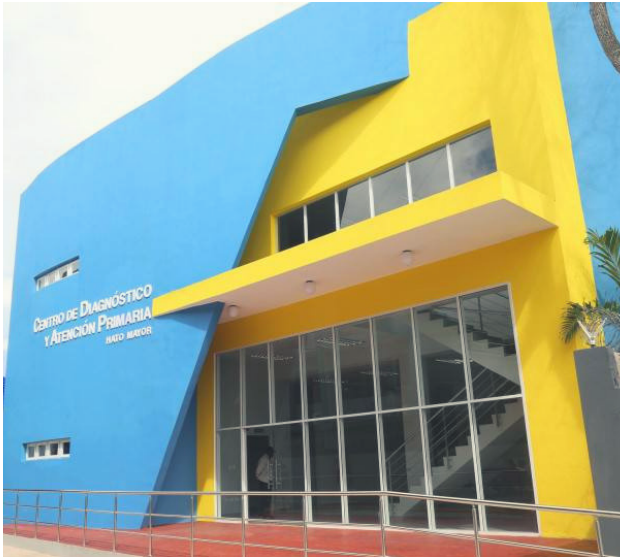
Centro de Diagnóstico y Atención Primaria

De los 50 centros de diagnóstico que incluyó el programa, han finalizado 35 y tienen diez en carpeta de entrega. “Ese programa termina a finales de julio, completo en un 100 %”, garantizó.