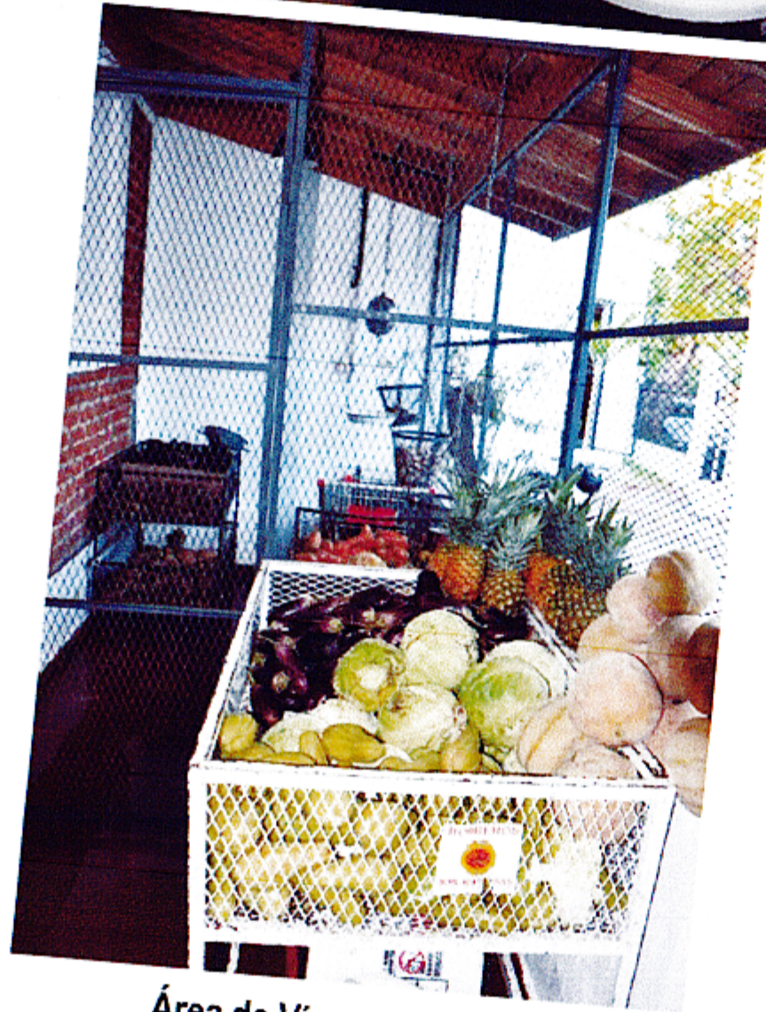
Área de Viveres y Frutas