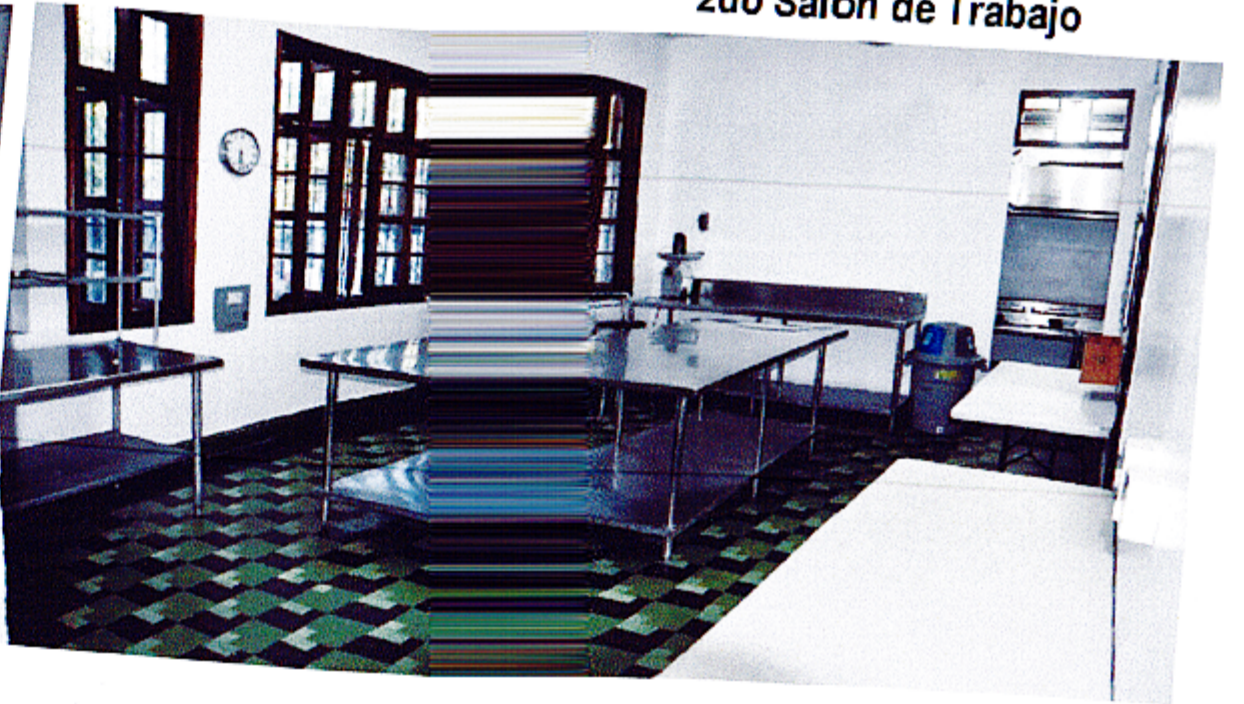
2do Salón de Trabajo