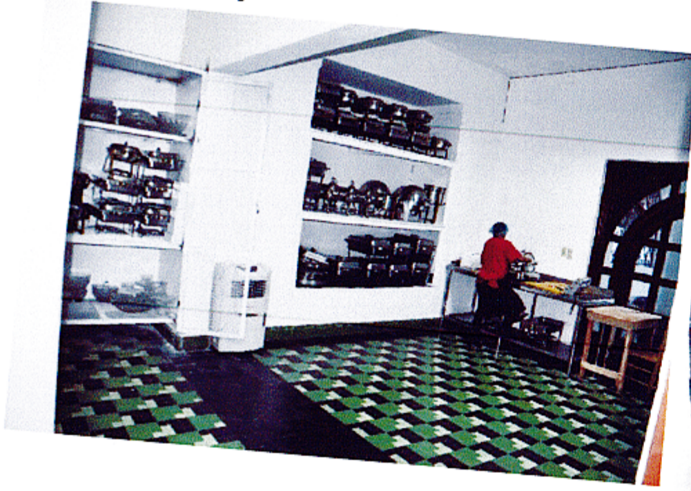
Salón de Trabajo