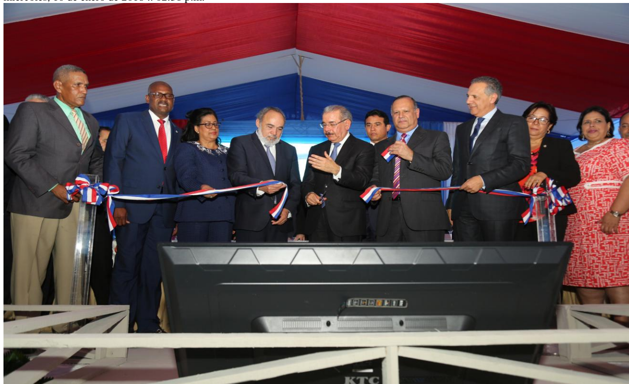
Acto de inauguración del Centro de Diagnóstico y Atención Primaria Corales de la Caña, ubicado en el sector El Almirante, en Santo Domingo Este, que contó con la presencia del presidente Danilo Medina.

miércoles, 10 de enero de 2018 :: 02:36 p.m.